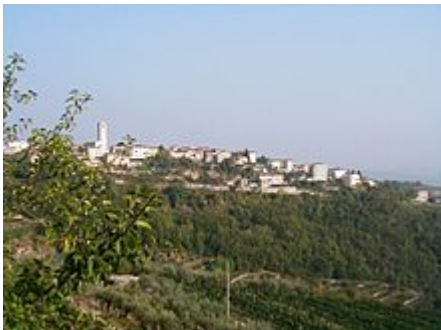
La frazione di San Giorgio