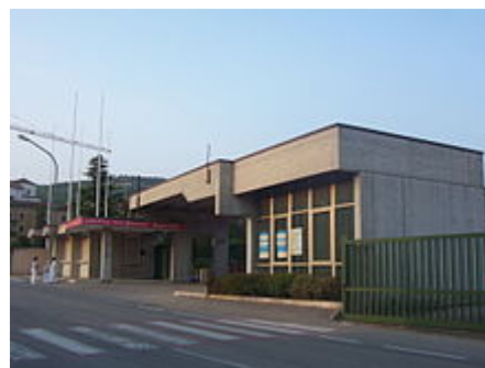
Vecchia entrata del quartiere fieristico di Sant'Ambrogio di Valpolicella. L'entrata è stata demolita per la costruzione di un parco all'interno.