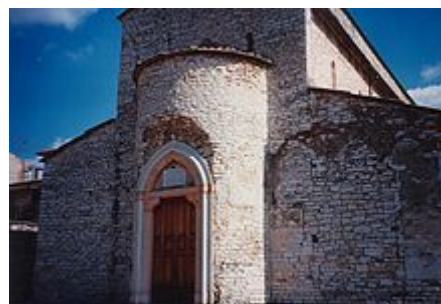
La pieve di San Giorgio, nell'omonima frazione