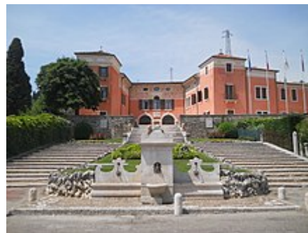
Sede del comune di Sant'Ambrogio

La Scuola d'Arte Paolo Brenzoni continua nell'insegnamento della lavorazione artistica del marmo. [15]