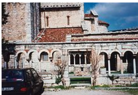
Il chiostro della Pieve di San Giorgio

All'incrocio delle strade che congiungono Verona a Trento, a valle dei monti che a guisa di anfiteatro circondano la Valpolicella, s'incontra S. Ambrogio, cittadina rinomata per i suoi marmi e vigneti. Agli inizi del XVIII secolo Scipione Maffei, celebre storico, scoprì a Fumane e a S. Ambrogio due lapidi, dalle quali dedusse che gli abitanti dell'attuale Valpolicella si chiamavano Arusnati. Il pagus Arusnatjum aveva il suo centro a S. Giorgio, probabilmente a causa della sua posizione geografica, e abbracciava i vicus di Fumane, Mazzurega, S. Ambrogio, Gargagnago, Volargne, Pescantina. In epoca romana, S. Giorgio divenne castrum con la stessa ampia giurisdizione sui centri citati.