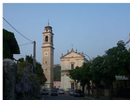
Chiesa parrocchiale di Sant'Ambrogio