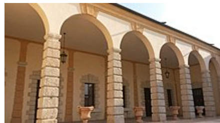
Villa Nichesola-Conforti, 1580-1590 circa, Ponton di Sant'Ambrogio di Valpolicella.