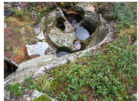
Marmitta dei giganti a Maloja.