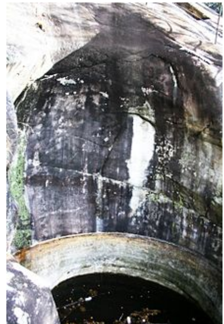
Marmitta dei giganti a Bad Gastein.