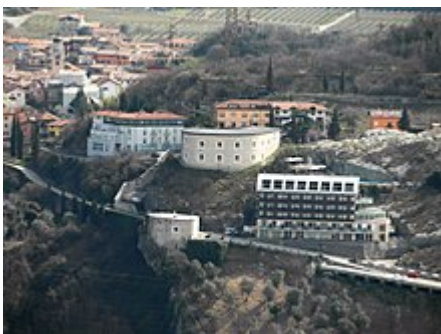
Vista del forte dal monte Brione

Il forte di Nago è un importante elemento della cintura di difesa (più o meno trenta fortificazioni) che fu decisa dall'allora governo austro-ungarico dopo la perdita della Lombardia a seguito della seconda guerra di indipendenza [1] .