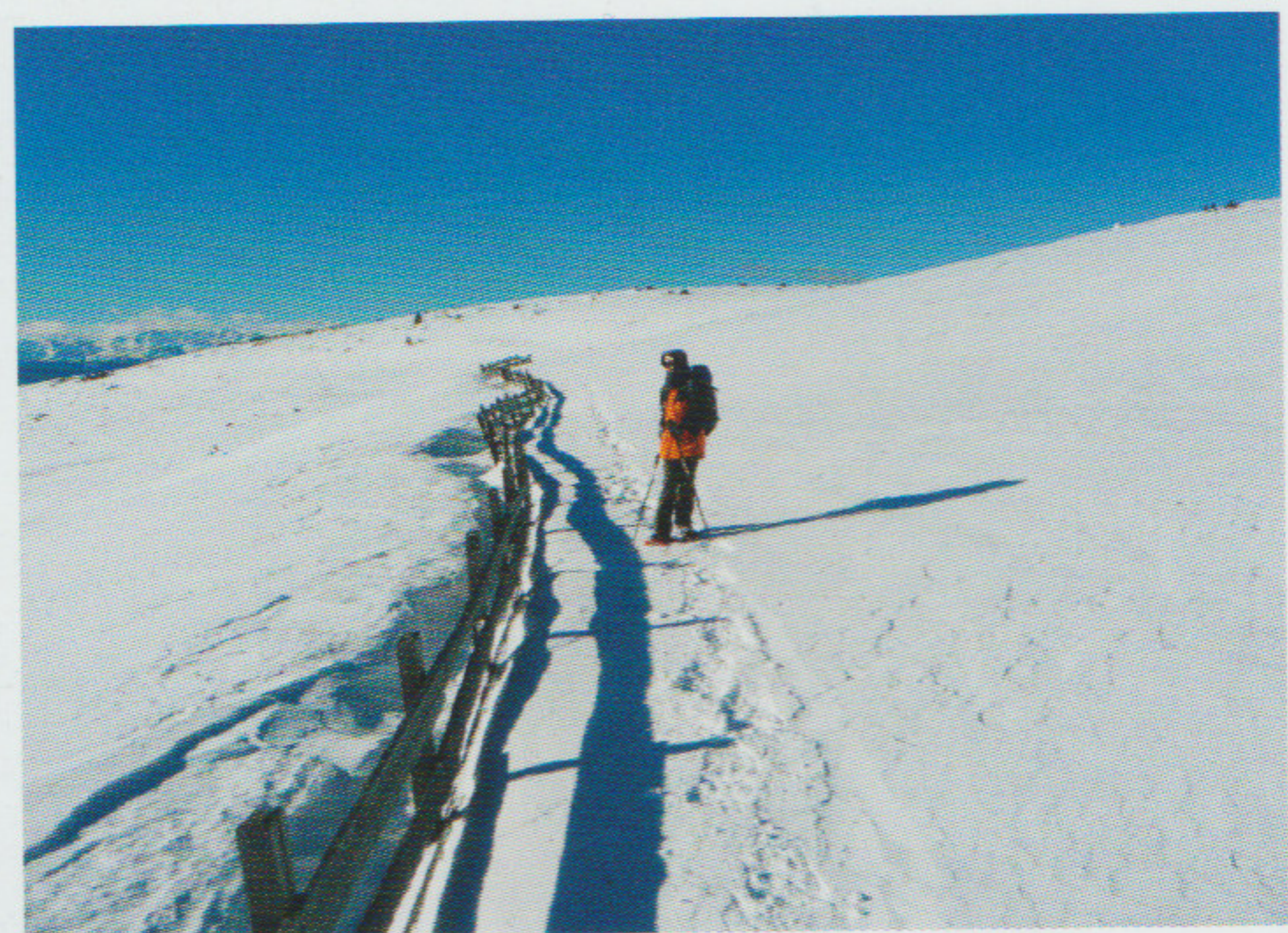
Tratto finale lungo lo steccato

un sentiero nel bosco in cui i segnavia biancorossi non coperti dalla neve sono rari. Seguiamo allora le orme degli animali selvatici che quasi