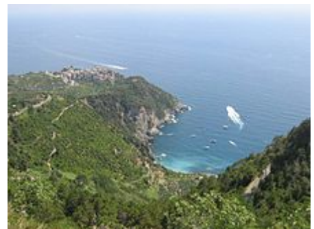
Panorama di Corniglia e della spiaggia di Guvano, viste da San Bernardino