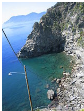
Marina di Corniglia

L'intero paese si sviluppa lungo la direttrice della via principale, via Fieschi, che conduce dalla parrocchia di San Pietro, fino al belvedere della terrazza di Santa Maria.