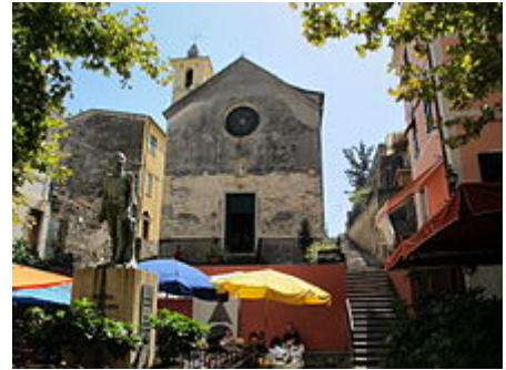
L'Oratorio dei Disciplinanti visto dalla piazzetta

Prima il Tar e poi nel 2009 il Consiglio di Stato [4] respinsero la proposta di costruzione di un nuovo Villaggio Europa sui resti del primo, in virtù di un ricorso rispetto all'incompatibilità ambientale del progetto e alle denunce di speculazioni arrivate dalle associazioni del territorio, seguite da inchieste su alcune testate locali.