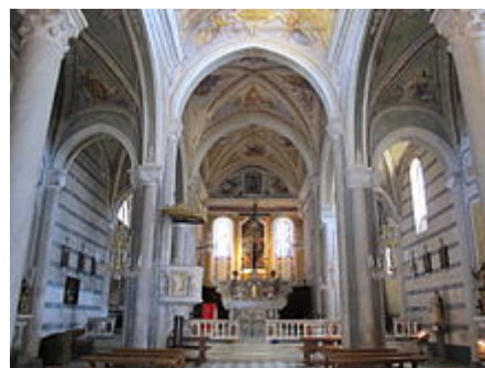
San Pietro, interno

Un edificio dotato di archi gotici in pietra nera, situato sotto il sagrato, viene ritenuto parte dell'antica stazione di posta appartenuta alla nota famiglia ligure dei Fieschi.