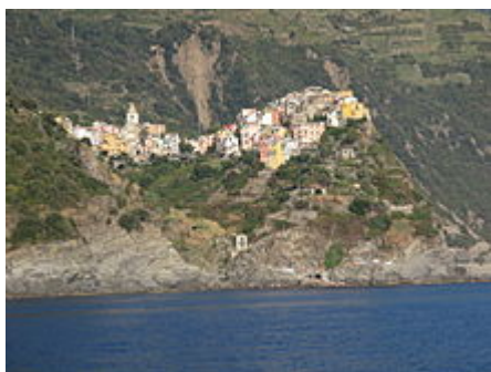
Corniglia vista dal mare

Durante il medioevo, analogamente ai borghi vicini, subì il dominio dei conti di Lavagna, dei signori di Carpena, di Luni. Nel 1254 il papa Innocenzo IV ne cedette il possesso a Nicolò Fieschi, fino a quando, nel 1276 il potere passò a Genova. Traccia nelle costruzioni dell'epoca medievale possono essere viste in Via Fieschi, dove alcune case sorgono sullo scheletro di un edificio medievale e nei pressi della piazza "Largo Taragio" da cui, salendo, si accede alla "Torre", ex presidio difensivo costruita nel XVI secolo con permesso della famiglia Fieschi, per difendersi dalle incursioni saracene. [2]