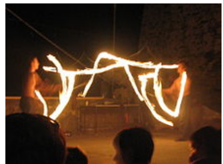
Un momento dell'esibizione dei Beefcake Boys in località Fosso (2007)

Corniglia - meta turistica al pari delle vicine "consorelle" - è conosciuta anche per una citazione letteraria di tutto rispetto. È menzionata infatti in un passo del Decameron di Boccaccio, esattamente nella novella che narra le disavventure dell'abate di Cluny: fatto prigioniero da Ghino di Tacco e sofferente di mal di stomaco, il prelado veniva curato dal suo stesso carceriere con