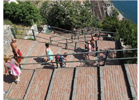
La scalinata della Lardarina congiunge il paese con la stazione ferroviaria

Corniglia è dotata di una stazione ferroviaria sulla direttrice tirrenica Genova-Roma, nel tratto locale compreso tra Genova e la Spezia. Per i treni a lunga percorrenza, la stazione di riferimento più vicina è quella di La Spezia Centrale.