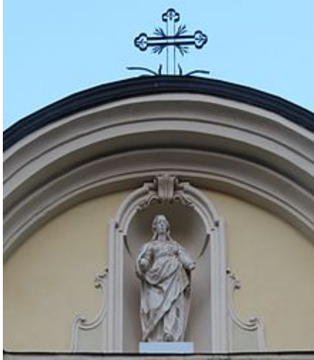
L'Immacolata. Copia della statua lignea di Raphael Barat posta nella nicchia superiore della facciata della chiesa

La facciata presenta due piani strutturali sormontati da un frontone barocco. Sono presenti nove nicchie ma solo cinque sono ora occupate con statue della Madonna, di san Pietro, di san Paolo e dei vescovi sant'Ambrogio e sant'Agostino.