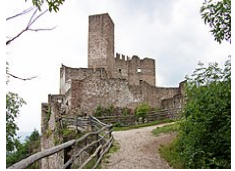
Il Castel Appiano

Per quanto riguarda l' artigianato , importante e rinomata è la produzione di mobili in legno , oltre all'attività di bottaio . [26]