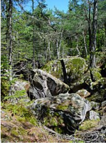
Le Buche di ghiaccio di Appiano , le Eislöcher

Si possono ammirare nei dintorni anche le Buche di ghiaccio , particolare monumento naturale detto Buche di ghiaccio di Appiano - Eislöcher .