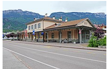
L'ex stazione di Appiano-Cornaiano, sulla Ferrovia Bolzano-Caldaro

Fra il 1903 e il 1971 la località era inoltre servita dalla stazione di Appiano-Cornaiano e dalle fermate di Ganda e San Paolo , poste lungo la ferrovia Bolzano-Caldaro .