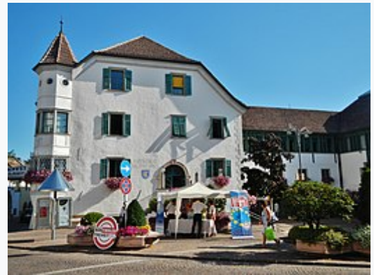
Il Municipio di Appiano, posto nella frazione San Michele