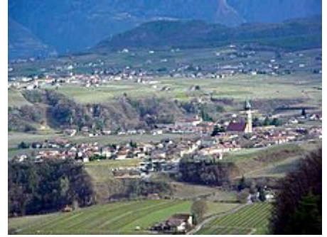
Le frazioni di San Paolo (in primo piano) e Cornaiano, viste da castel Boymont

Nel 1973 il comune aggiunge al proprio nome la dicitura "sulla Strada del Vino".